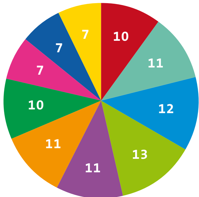
Bevölkerung in Bayern Strukturangaben in %